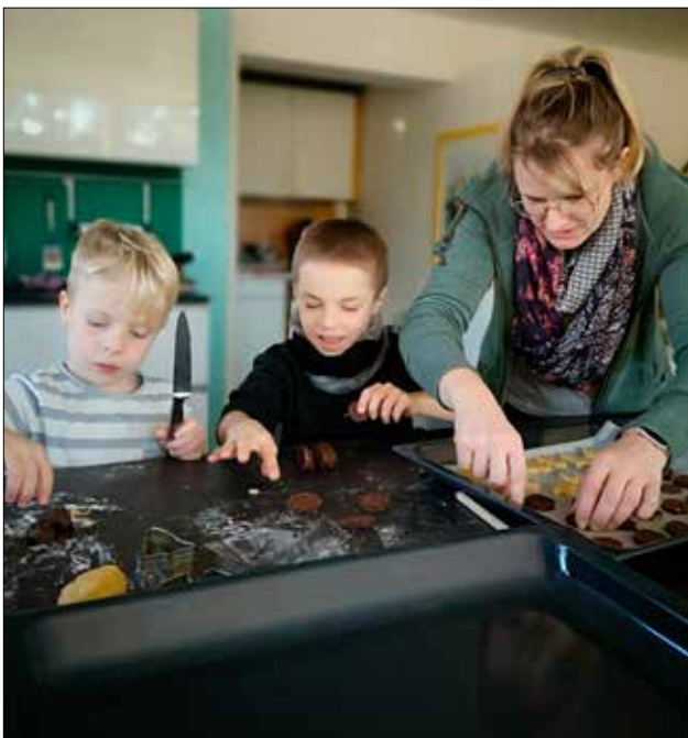
Mit Begeisterung bei der Sache