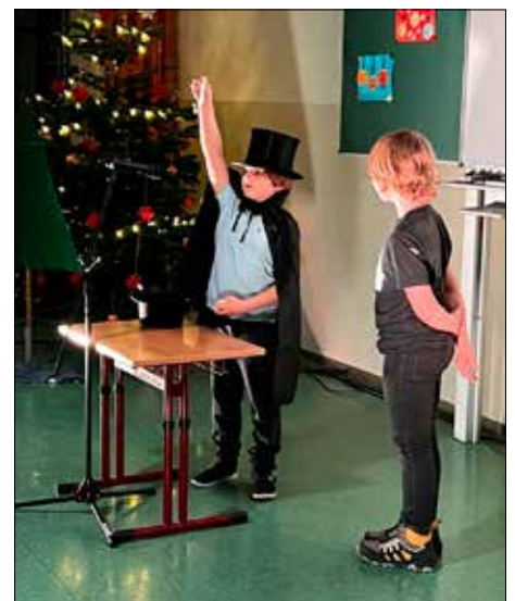
Zauberei, Gesang und Tanz im Adventsprogramm