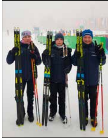
Unsere drei Starter beim Nachtrennen in Oberwiesenthal

Zum zweiten Mal gingen der Pokal und die Siegertorte damit in unser Nachbarland.