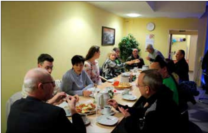
Die ersten geladenen Gäste