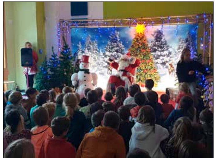
Der Weihnachtsmann in Aktion

Es grüßt ganz herzlich das Erzieherteam des Fichtequirle Hortes und wünscht allen noch ein schönes erlebnisreiches Jahr 2024.