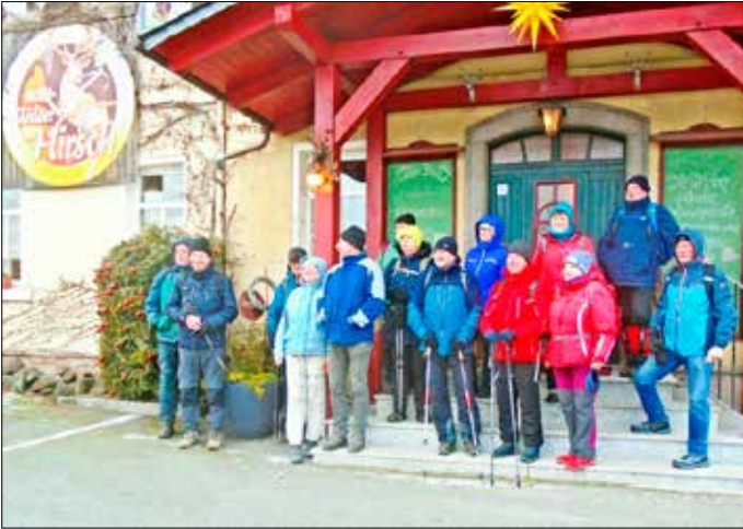
Wandergruppe vor der Rast

Blick von dem kleinen Parkgelände an der Gaststätte auf dem Hutberg geht über die kleine Stadt attraktiv zu den Bergen des Zittauer Gebirges, ist aber bei sonnigem Wetter noch sehr viel attraktiver. Nun waren es nur noch ein paar Schritte für die 20 Wanderinnen und Wanderer, die alle die Kälteprüfung mit 17 km und 380 Hm gut überstanden hatten, zu den Autos auf dem Parkplatz.